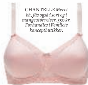
CHANTELLE Mercibh, fås også i sort og i mange størrelser, 550 kr. Forhandles i Femilets konceptbutikker.

Du kender hende nok alt for godt, og du har med sikkerhed også savnet hende. Langt om længe er Renée Zellweger tilbage i rollen som Bridget Jones i ' Bridget Jones' baby ', og det kan kun blive godt! Med Colin Firth og Patrick Dempsey på rollelisten er der lagt i kakkelloven til endnu en romantisk komedie, som bestemt vil både overraske og more, når Bridget erfarer, at hun er gravid uden at ane, hvem faren til barnet er. Premiere: 15. september.