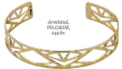
Armbånd, PILGRIM, 249 kr.

Det er ikke en frøken-hvem-som-helst, som det danske smykkefirma Pilgrim har valgt som galionsfigur for deres efterårskampagne. Det er selvfølgelig ingen ringere end superskønheden Josephine Skriver, og man må sige, at hun bærer de enkle guld- og sølv-smykker ualmindelig godt. Værd er især at bemærke de cool armbånd, halskæder og ringe med cutout-efekt i forgyldt sterlingsølv, som står godt til en stilren garderobe. Priserne er også cool, for de ligger stort set alle under 300 kroner.